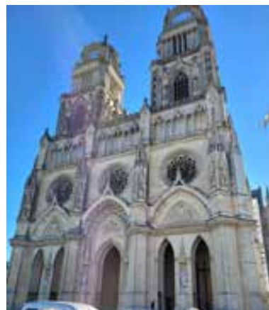
La cathédrale d'Orléans.