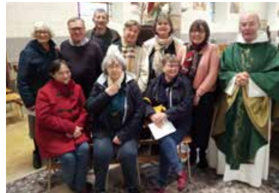
Une partie de l'équipe missionnaire