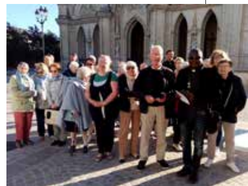
Le groupe des pèlerins.