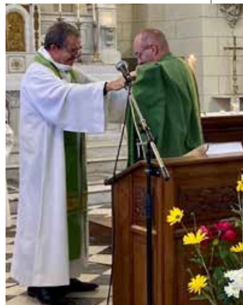
La remise de la chasuble.