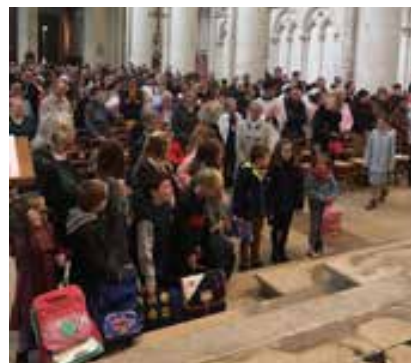
Messe de rentrée du caté à Saint-Latuin.

En préambule à la rentrée des catéchismes, la paroisse avait un stand au forum des associations. Une première prise de contact avec les familles. Le 24 septembre dernier, les enfants du catéchisme de la paroisse St-Gilles-en-Haute-Sarthe se sont retrouvés pour leur première rencontre. Ils se retrouveront tous un samedi matin par mois pour une réunion de trois heures. La participation à la messe du dimanche fait partie de la catéchèse. Le jeune peut y faire l'expérience de la rencontre avec Jésus et se rendre compte qu'il fait partie d'un groupe beaucoup plus important que l'équipe des catéchistes. Les familles sont donc invitées à y accompagner leurs enfants. Cette organisation permet de limiter les déplacements et favorise les regroupements. Cette année, il y a 49 enfants inscrits (7 CE1, 8 CE2, 12 CM1, 7 CM2, 15 sixièmes), mais dix de moins que l'an dernier. La plupart viennent de 17 communes de la paroisse mais pour des raisons de transport et d'horaires, douze viennent de cinq communes du secteur de Courtomer qui fait partie du pôle missionnaire et deux viennent de communes hors du pôle. Nous accueillons des enfants baptisés mais aussi quelques enfants qui sont en demande.