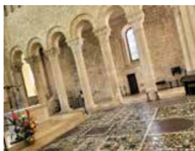
Le dallage de l'église Saint-Benoît.