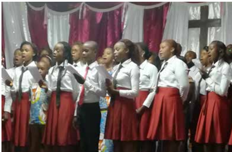
▲ À Mbujimayi, enfants et jeunes participent nombreux aux célébrations.

“ Les familles se pressent en masse à la messe du 25 décembre.”