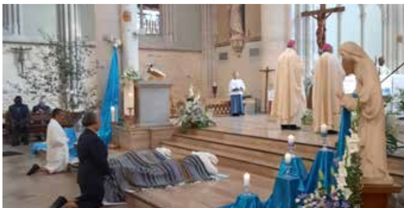
La prostration, un moment toujours impressionnant.