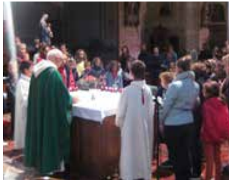
▲ Célébration avec les jeunes à Bellême. La marche, une occasion de rencontres. ►

Quels événements t'ont procuré le plus de joie et à l'inverse, le plus de peine, souffrance ou déception ?