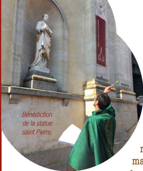
Bénédition de la statue saint Pierre.