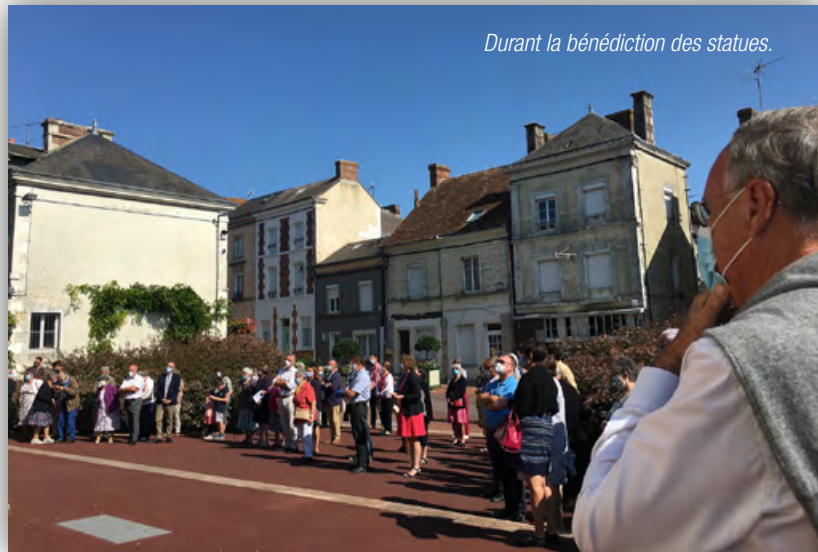
Durant la bénédiction des statues.