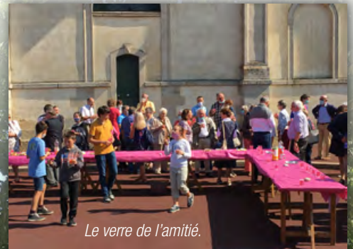
Le verre de l'amitié.