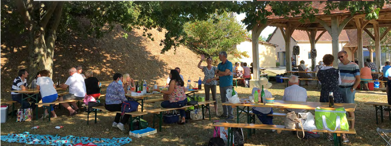
Le pique-nique à Saint-Léger-sur-Sarthe.