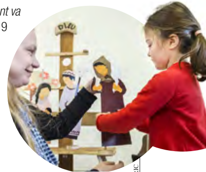
Confiance Mercier / CTRIC

enfant, précise le livret Votre enfant va au caté , publié au printemps 2019 chez Mame-Tardy. Les parents sont invités à accompagner le plus possible leur enfant dans sa démarche, même sans devenir eux-mêmes catéchistes.