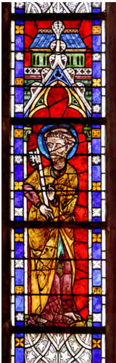
Chapelle axiale : l'une des cinq représentations de saint Pierre, assez bien conservée, sur fond rouge. Départ de grisaille au-dessus et au-dessous - 1270-1280.

La cathédrale a été vitrée entre 1270 et 1280, sur un temps court donc. Il en