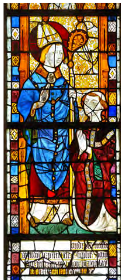
Chapelle Saint-Nicolas : saint Nicolas bénit le chapelain Oudin de Troyes, venu avec son évêque à Sées en 1363, comme le précise le texte inscrit en bas du vitrail - 1370.