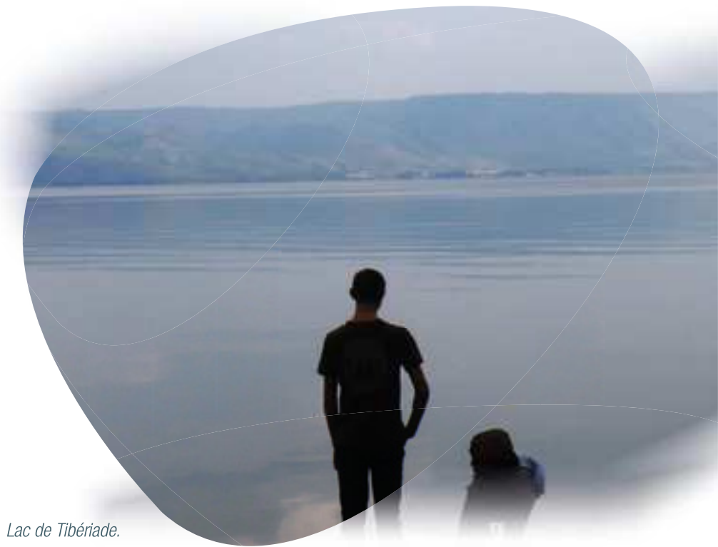
Lac de Tibériade.

L'eau est très présente dans la Bible. La création se fait en rassemblant les eaux "en une seule masse" pour que le monde soit en ordre. Le peuple hébreu n'était pas un peuple marin mais le récit du passage de la Mer Rouge est le grand événement de son histoire.