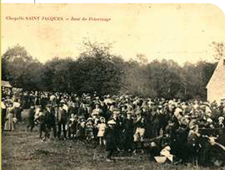
Chapelle SAINT JACQUES - Jour de Pèlerinage

La chapelle Saint-Jacques et les bois alentour sont propriété privée. Il nous est demandé de rester groupés et de ne pas nous rendre individuellement sur les lieux. Seules les personnes ayant des difficultés à marcher seront autorisées à venir en voiture.