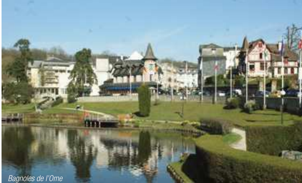
Bagnoles de l'Orne