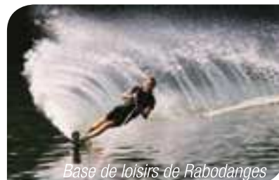
Base de loisirs de Rabodanges