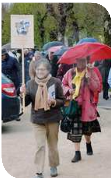
Rallye au pays d'Essay

À la retraite, cherchant à m'occuper utilement et agréablement, j'ai commencé par